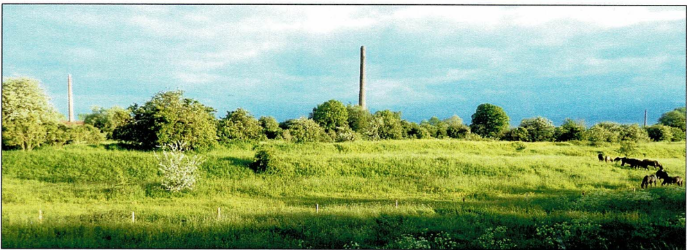
Drie steenovenschoorstenen v.l.n.r.: Heteren, Jufferswaard (Renkum) en Randwijk, in driehoekverband langs de Neder-Rijn. voorjaar 2021

In september 2017 werd op de Open Monumentendagen, door HGR georganiseerd, de zogenaamde 'Pilogroep' opgericht, een groep vrijwilligers behorend bij de Stichting Renkums Beekdal. "Pilo" is nu een geuzennaam die vroeger de koosnaam was die de steenovenarbeiders, Renkumers en anderen, gaven aan de fabriek en/of aan de fabrieksbazen: ze werkten "bij Pilo". Veel - nu oude - Renkumse mannen hebben in hun jongensjaren de Pilo-schoorsteen beklommen. Het boekje "Pilo, feiten en verhalen" is door ons uitgegeven en beschikbaar bij HGR, in het Informatiecentrum Renkums Beekdal en bij Ina Loenen. De Open Monumentendagen van 2017 zijn gebruikt om aandacht te vragen voor o.a. de cultuurhistorische elementen in de Jufferswaard, in samenhang met de natuur. Er is intussen verdienstelijk gewerkt door de Pilogroep: maandelijks schoonmaak door de Pilo-schoonmaakploeg, er zijn natuur-/cultuurexcursies geweest en er is van het gebied intussen een uitgebreid gebruiksonderzoek gedaan door de WUR, waarvan het rapport eind 2019 in het Infocentrum Renkums Beekdal is aangeboden (zie https://edepot.wur.nl/496590 ). Dat vormt nu de basis voor gesprekken met de eigenaar van de Jufferswaard: Staatbosbeheer.